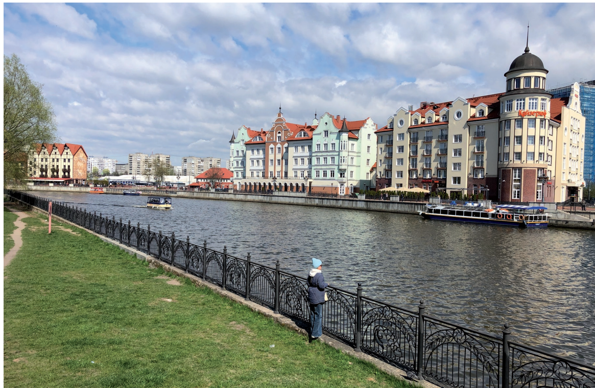
📍 Набережная реки Преголя.

В музее «Фридрихские ворота» создана экспозиция «Ры-