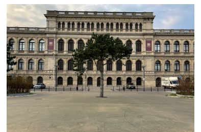
📍 Музей изобразительных искусств

к берегу, утопая в мягком песке. Немного завидуя, посмотрели на смельчаков, которые решились помочить ноги в холодном море, наблюдали за чайками и с удовольствием перекусили в кафе с видом на побережье.